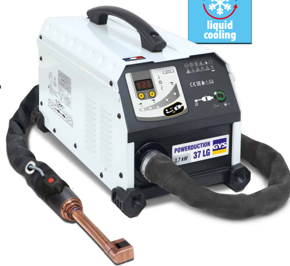
Générateur livré complet et déjà monté, avec 1 inducteur de chauffe 90°.