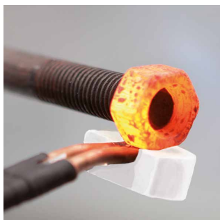
Dégrillage de boulons