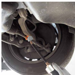
Déblocage des biellettes de direction