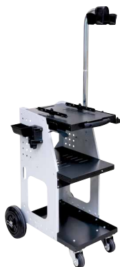
ref. 051331 + 052284 UNIVERSAL 800 + potence