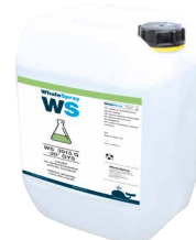
ref. 062511 Liquide de refroidissement spécial soudage - 5 l