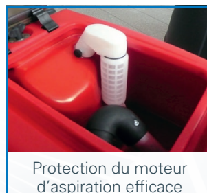
Protection du moteur d'aspiration efficace