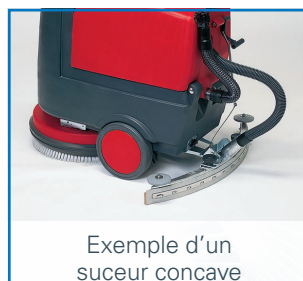
Exemple d'un suceur concave